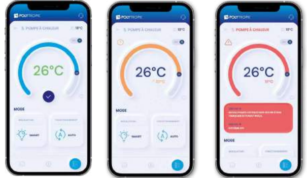
Sıcaklık ayar noktası ayarı, sıcaklık sınırı bildirimi, uyarı mesajı

Tam bir takip sağlamak için Polyconnect ile bağlantılı sistemlerden toplanan tüm veriler beş yıl boyunca saklanır: