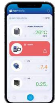
Bağlı ekipmanların listesi