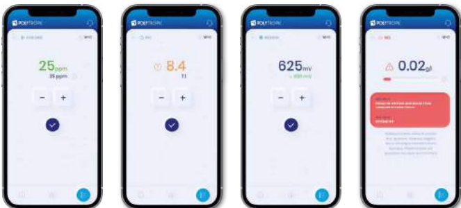
Su arıtma sisteminin uzaktan izlenmesi: değerler, ayarlar ve alarmlar

Bir birimin parametrelerini kontrol etmesi için birini göndererek kaynakları boşa harcamanıza gerek yok, hepsi ofisten yapılabilir. POLYCONNECT zaten tüm bilgilere sahip!