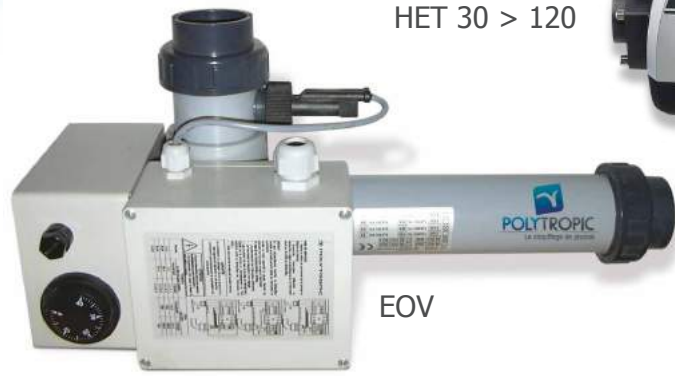
HET 30 > 120