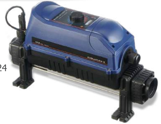
HET 15 > 24